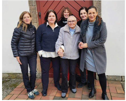
Das Kirchen-Kaffeeteam | Foto: privat