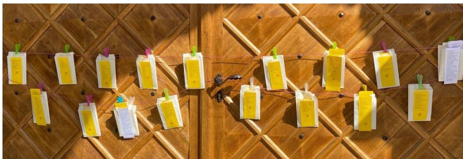
Ostertexte an der Tür der Pauluskirche