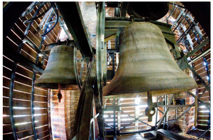
Die Glocken der Pauluskirche

Die mit Tränen säen, werden mit Freuden ernten (Psalm 126,5).