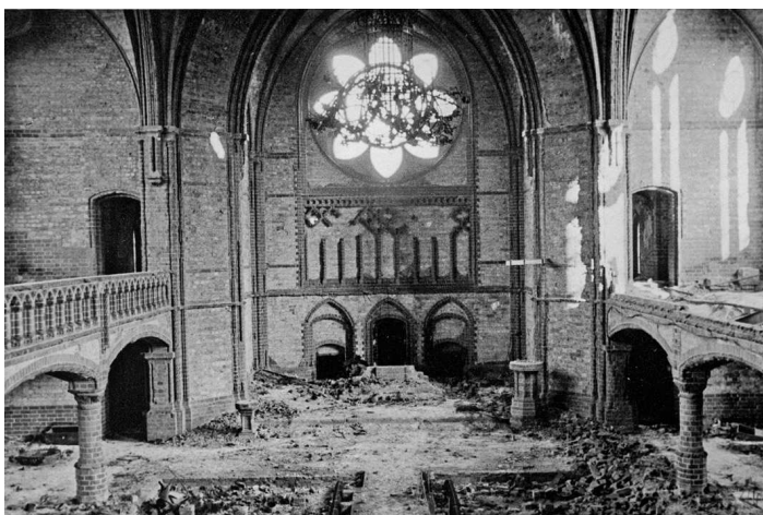
Die zerstörte Kirche

Im Jahre 1943 begannen verheerende Bombardements auf die Stadt, denen auch viele Privathäuser in der Umgebung zum Opfer fielen. Die Menschen retten, soweit möglich, ihr Hab und Gut, das sie in ihrer Not in der bis dahin unversehrten Pauluskirche unterbrachten. Am 23./24. März 1944 allerdings wird die Pauluskirche von Bomben getroffen und brennt, nicht zuletzt durch das viele eingelagerte Mobiliar eine ganze Woche.